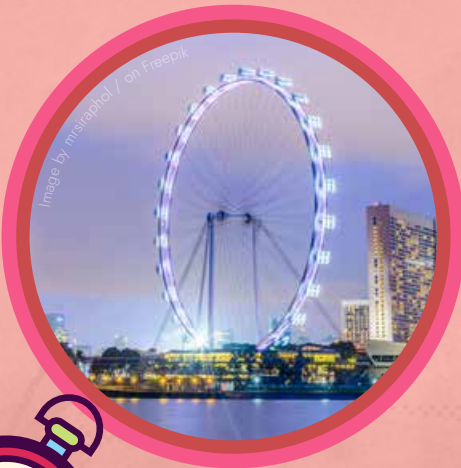
LONDON EYE LONDRES